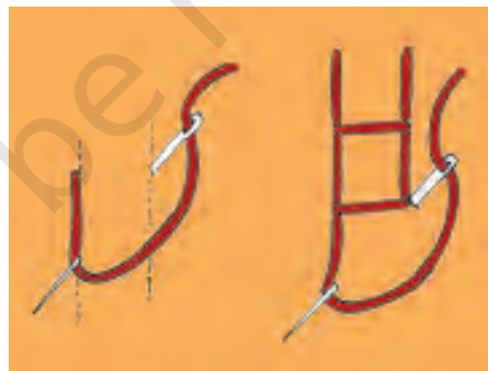
खुला हुआ ज़ंजीर टाँका